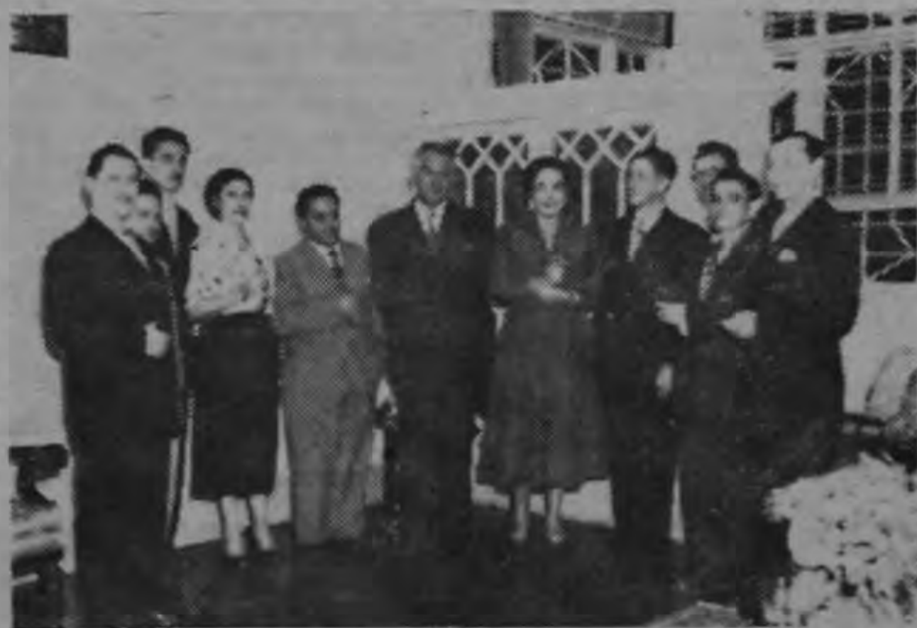
Concurrentes a la recepción realizada en la noche del jueves en la Embajada de Guatemala, con motivo de la entrega del Premio Tercero de Poesía del Concurso Centroamericano que organiza aquel país, y cuya distinción fué ganada por el poeta costarricense Eduardo Jenkins Dobles.

El jueves pasado, tal como fué anunciado oportunamente, se efectuó en la Embajada de Guatemala, el acto de entrega de Diploma y Medalla de Oro al poeta costarricense Eduardo Jenkins Dobles, quien obtuvo el Tercer Premio en el Certamen Permanente de Ciencias, Letras y Bellas Artes "15 de Setiembre", que anualmente se celebra en Guatemala.