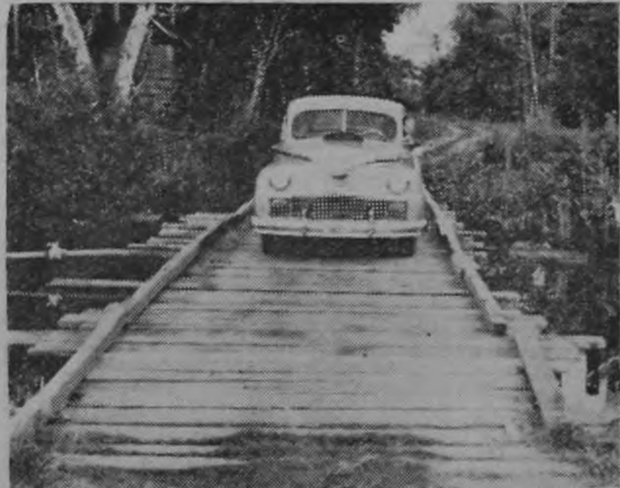
Puente Negro. — Los comentarios sobran.

HAGA SUS PISOS con tabloncillo de Surá. Hecho en la Acepilladora — Melchor Guzmán S.A. — P.O. Box 1000 — San José, Costa Rica. — Teléfono 2-1111.